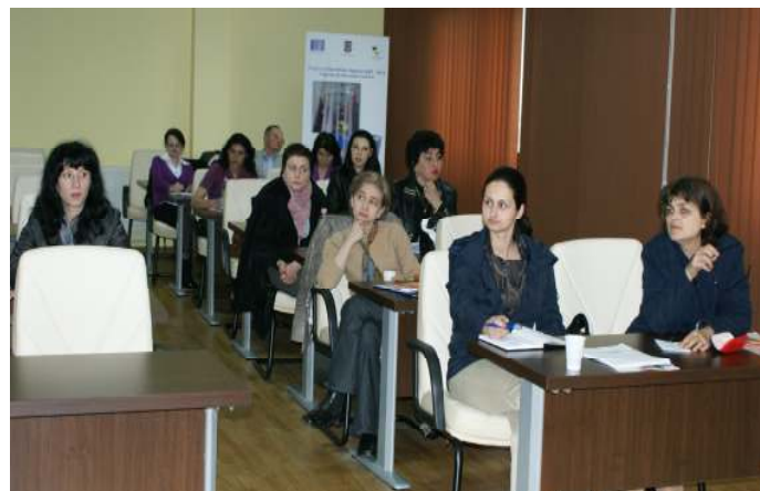
Aspect din sala de conferințe