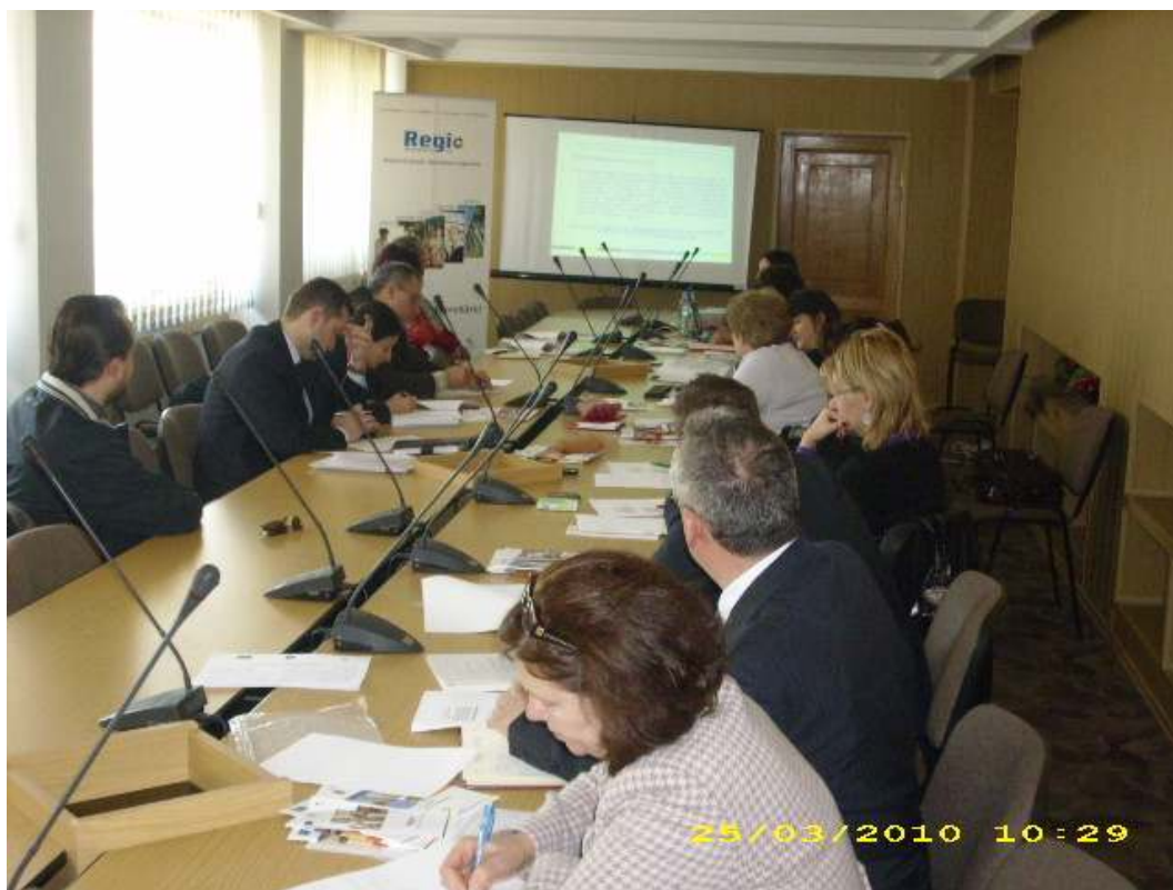
Aspect din cadrul Seminarului organizat la Braila

Au fost prezentate avantajele de care ar putea beneficia mediul de afaceri prin această Axă , fapt care ar conduce la creșterea gradului lui de dezvoltare. Experții ADR SE au răspuns întrebărilor invitaților cu privire la eligibilitatea solicitanților, activitățile eligibile, completarea cererii de finanțare, proiectele generatoare de venituri, regula ajutorului de minimis, la documentele deținute de către solicitanți asupra dreptului de proprietate al imobilelor și terenurilor destinate implementării proiectelor și s-a insistat pe modul de acordare a prefinanțării.