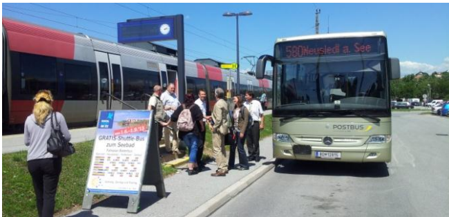
Transfer direct din tren catre autobuz in Neusiedler am See, Austria

Cum sa implementam mobilitatea sustenabila in turism? Centrul de Competenta Dunarean (IPA PP1) a adunat exemple de bune practici, care au fost implementate in ultimii ani, in regiunea Dunarii si nu numai. O analiza a acestor exemple de buna practica arata in mod clar complexitatea acestor proiecte ce necesita solutii complexe si o buna coordonare la nivel intersectorial, in special a actorilor din transport si turism, nevoia de a integra sustenabilitatea la nivele strategice cum ar fi: planuri de dezvoltare regionala sau turistica, cresterea constientizarii atat pentru public cat si pentru vizitatori si importanta schemelor de finantare pentru a initia si implementa mobilitatea sustenabila in regiuni.