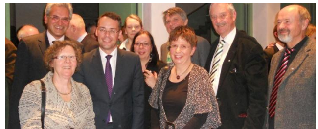
Partenerii proiectului, Oficiul Dunarii din Ulm, la “Salonul Dunarii”.

Partenerii proiectului au demarat activitatea de promovare a conceptelor proiectului cu ocazia diferitelor evenimente si ateliere de lucru din regiunile lor. La expozitia mondiala de turism (Bursa Mondiala de Turism) de la Berlin, proiectul TRANSDANUBE a fost reprezentat de Comisia de Turism a Dunarii din Austria, Biroul Dunarii din Germania si de Centrul de Competenta in Regiunea Dunarii din Serbia.