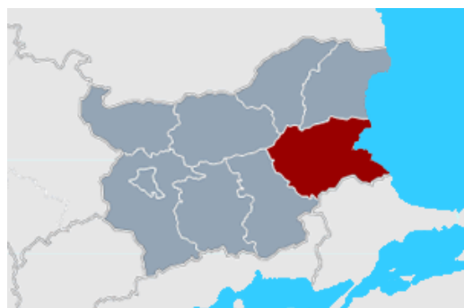
Regiunea Sud-Est a Bulgariei

In Bulgaria, studiul acopera zone protejate de legislatia bulgara si Natura 2000 din regiunea Sud-Est si sunt sub administrarea Inspectoratului regional in domeniul apei si mediului din Burgas si Stara Zagora. Acesta cuprinde aproape 100 de zone, din care 18 au fost localizate, inclusiv zona tinta a proiectului – Lacul Vaya din Burgas.