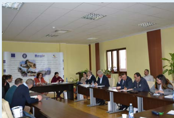
Aspecte din timpul întâlnirii de lucru