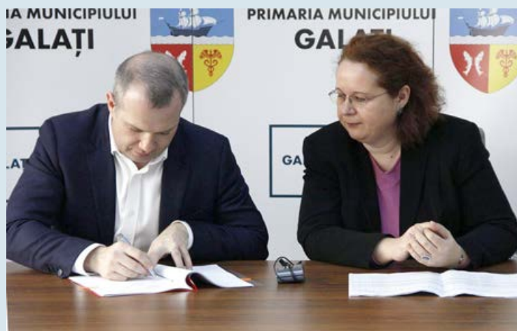
Galați, martie 2018

reabilitare termică cu bani din fonduri europene. Este primul contract, sperăm, dintr-o serie ceva mai lungă de finanțări care le atragem pentru refacerea instituțiilor de învățământ. În total vor fi șapte școli care vor fi anvelopate și vor avea dotări moderne din toate punctele de vedere” , a declarat primarul municipiului Galați. Valoarea totală a investiției se ridică la peste 2,9 milioane lei, din care circa 2,4 milioane lei reprezintă valoarea finanțării nerambursabile. Durata de implementare a proiectului este de 22 de luni.