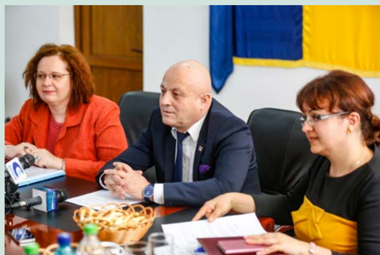
Buzău, martie 2018

Valoarea totală a investiției de peste 18,4 milioane lei iar contribuția Consiliului Județean va fi de peste 340 mii de lei, ceea ce reprezintă un procent de 2 la sută, restul reprezentând fonduri europene și guvernamentale.