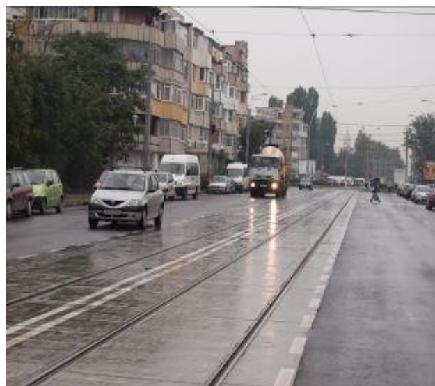
Strada Basarabiei a fost finalizată cu două luni în avans față de graficul de activități.